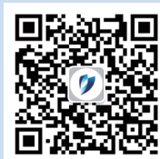
深交所官方微信公众号